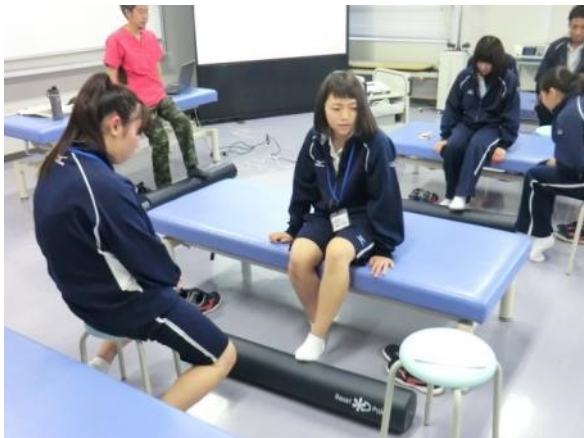
足の下でストレッチポールをコロコロすると…