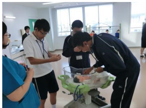
新生児の心拍と呼吸が分かる人形です。 班対抗で心拍数と呼吸数を測定しました。