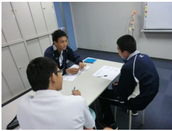
“あ”から始まる食べ物を言います。 何個言えたでしょうか？