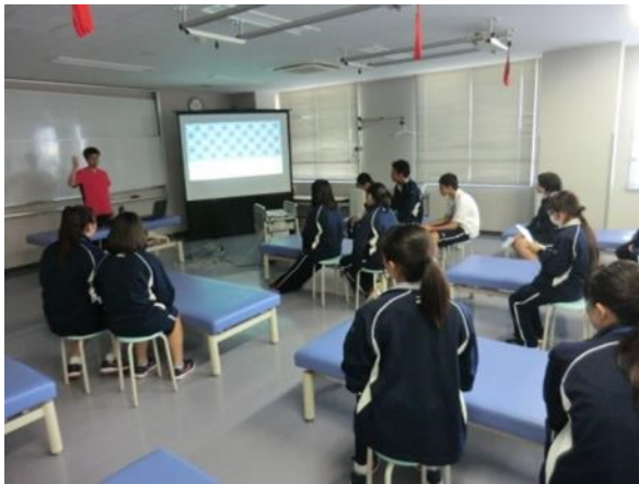
理学療法の仕事内容を聞いています。