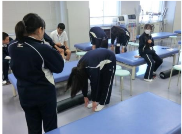
なんと！身体が柔らかくなりました！！ しかし個人差があるようです。