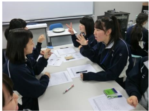
相手に負けるじゃんけん。忍耐力を測るテストです。 思わず勝ってしまうときも…。