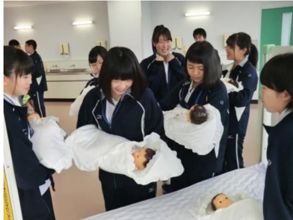
他の班が測定している時に、内臓が分かる人形を見たり、赤ちゃんの着替えなどを体験しました。