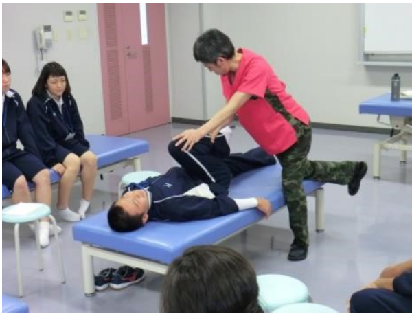
ストレッチの仕方です。 これでも柔軟性が上がるそうです。