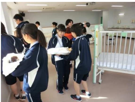
生まれてからの月日と体重の変化が分かる 人形を抱えています。