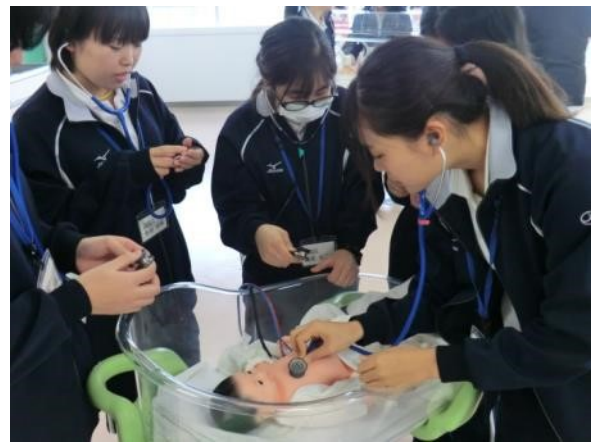
どの班も真剣に測っています。その中でびたりと狂いなく測れたのは、男子チームでした！！