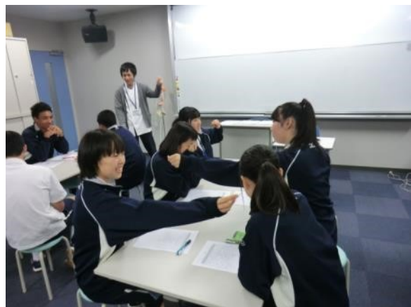
耳のそばで指の擦る音が聞こえるかの体験です。