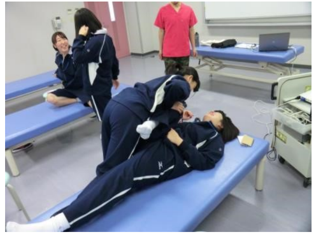
生徒同士でストレッチしている様子。

以上、たくさんのご体験させていただきました。柔軟性が増す体験には、みんな驚いていました。