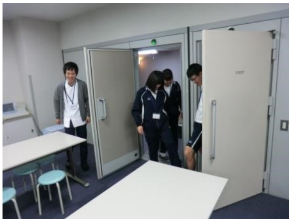
防音の部屋です。中で叫んでも外には聞こえません。