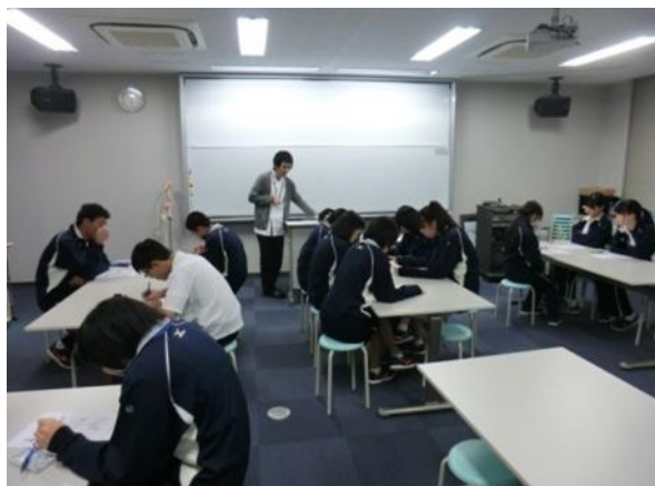
検査室での言語聴覚療法の体験学習です。