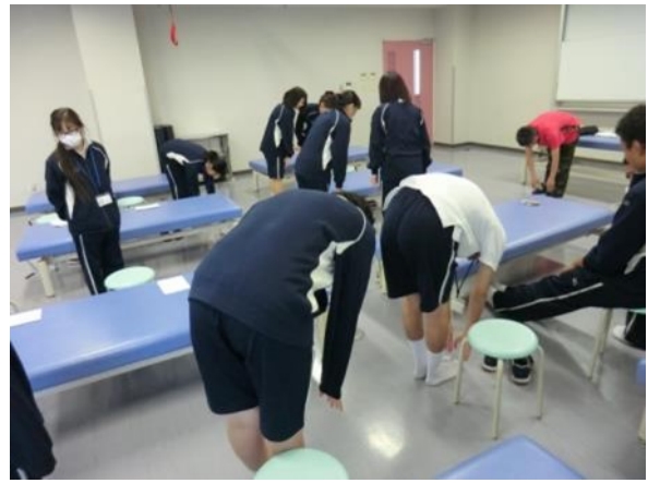
まずは柔軟。身体が硬い人がいます。